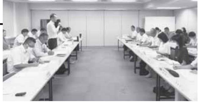
愛知県との政策要望懇談会

今回の意見交換を踏まえて、10月下旬には愛知県知事との懇談会を実施し、各種要望事項の来年度当初予算への反映に向けた取り組みを進めていきます。