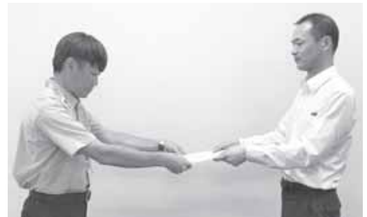
名古屋市人事委員会

また、8月30日(金)には名古屋市人事委員会に対する要請行動も実施し、要望書の提出を行いました。