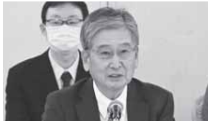
愛知県経営者協会 大島会長