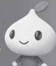
公式キャラクター ビットくん

「こくみん共済 coop」は営利を目的としない保障の生協として共済事業を営み、相互扶助の精神にもとづき、組合員の皆さまの安心とゆとりある暮らしに貢献することを目的としています。この趣旨に賛同いただき、出資金を払い込んで居住地または勤務地の共済生協の組合員となることで各種共済制度をご利用いただけます。