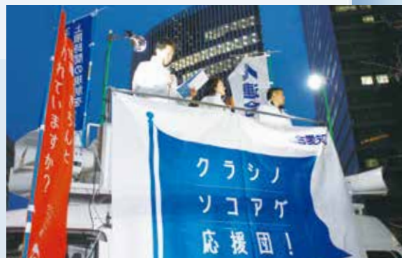
▲クラシノソコアゲ応援団! RENGOキャンペーン街頭宣伝行動