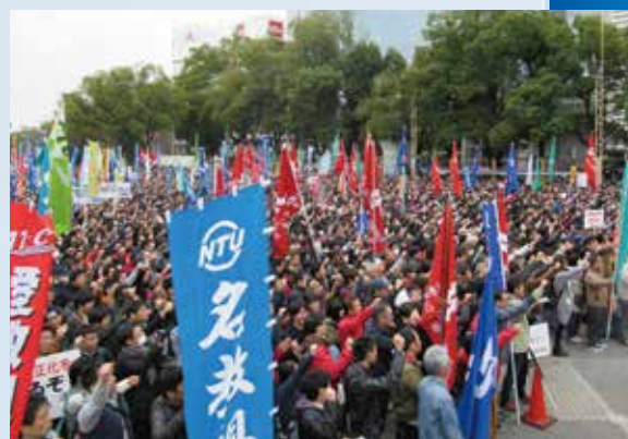
▲春季生活闘争1万人総決起集会