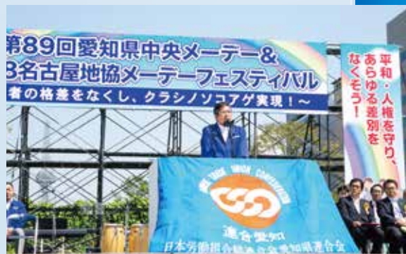
▲第89回愛知県中央メーデー