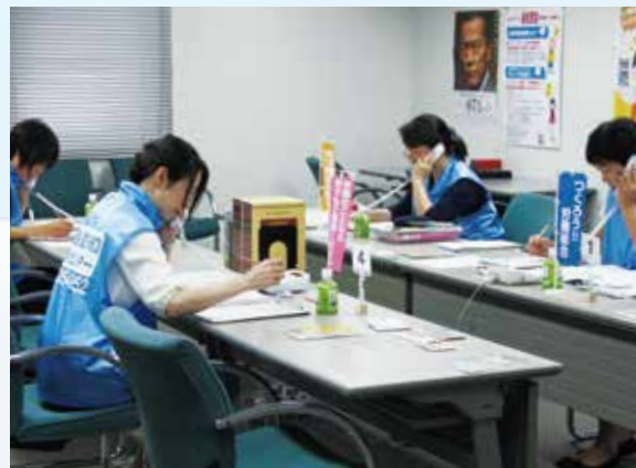
▲全国一斉労働相談ホットライン

○将来にわたり揺るぎない組織として、運動を強化・発展させるために、その基盤として必要不可欠な人材の安定的確保をはかるとともに、財政運営の充実に向けて、引き続き検討・実践していきます。さらに、2019年11月に、連合愛知は結成30周年を迎えることから、「30周年記念事業検討プロジェクト」を中心に準備を進めていきます。