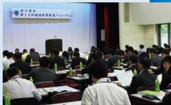
▲地域政策推進フォーラム