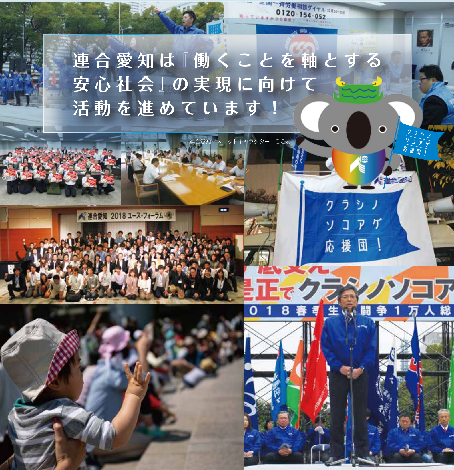
連合愛知マスコットキャラクター ここあ