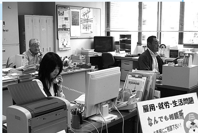
精一杯の相談活動をしています

「一人でも多くの働く仲間に勇気と元気を！」今後も名古屋地協は精一杯の相談活動に取り組んでいます。