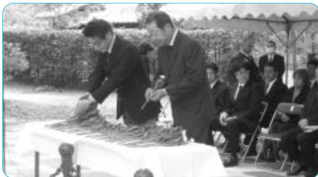
いしずえの碑前で献花する参加者