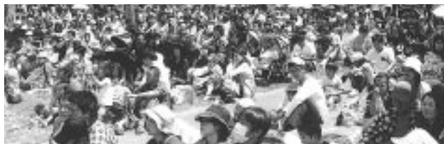
会場の「豊橋総合動植物公園 / 野外コロシウム」は参加者で一杯!

80 回を数えた豊橋地区メーデー。今年は天候にも恵まれてこれまでの最大規模である4,300名の組合員と家族が参加しました。子ども向けのアトラクションに続いて、メーデー式典と大抽選会が行われます。組合員と家族にとっては組合を身近に感じてもらえる絶好の機会となっています。