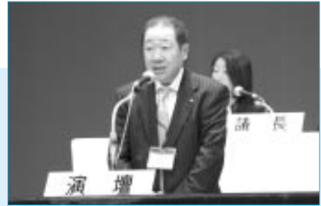
活動方針を提案する度会事務局長

労働文化交流協定に基づき、江蘇省总工会の代表団の受け入れを行うとともに、「連合愛知第7次・愛知労福協第12次友好訪中代表団」を派遣し、相互交流に取り組む。また、2010年の上海万博を成功させるべく愛知労福協と連携して訪中団を派遣し、日中両国の友好交流をさらに深める。