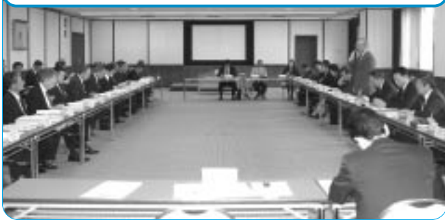
愛知県との懇談会

連合愛知は、勤労者・生活者の立場に立った施策を行政に反映させることを目的として、愛知県と名古屋市のそれぞれに、毎年、重点要望書を提出している。