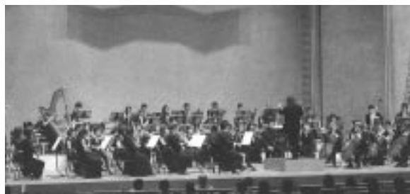
フルオーケストラで演奏する 豊橋交響楽団の皆さん

ご 当地にはアマチュアの「豊橋交響楽団」があり、これまでに100回を超える定期演奏会を実施するなど目覚ましい活動を行っています。3年前から、豊橋交響楽団のご厚意で地協主催による夏休み期間中の親子の触れ合いを目的とした「夏休みふれあいコンサート」を実施しています。たまには格調高い文化の香りに触れるのもいいものです。