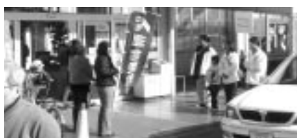
早朝から年末助け合いカンパ活動