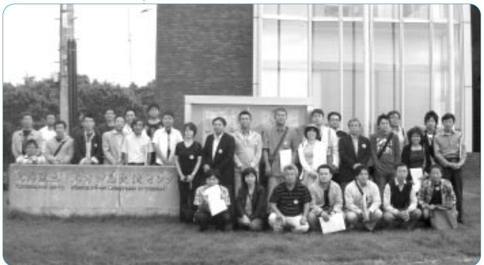
「2009平和行動in根室」に参加した組合員

などのあいさつや元島民の訴えに続いて、北方四島の一括返還を求める集会アピールが採択された。参加した組合員は、北方四島が日本固有の領土であることを再認識し、早期返還への想いをいっそう強くした。