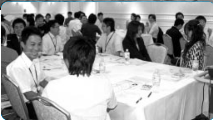
楽しみながらコミュニケーションスキルを学ぶ

連合愛知青年委員会は9月9日、Reception House 名古屋通信会館において、各構成組織から若年層組合員等84名の参加を得て「2009ユース・フォーラム」を開催した。このユース・フォーラムは、若年層組合員が連合愛知及び連合愛知青年委員会の諸活動に対する理解を深めるとともに、構成組織を超えた若年層組合員による交流の促進、さらには、幅広い視野をもった次代を担う人材の育成を図ることを目的として開催している。