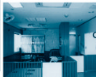
▲ファミリアールームみゆき園床・壁・エアコンなどの改修・整備