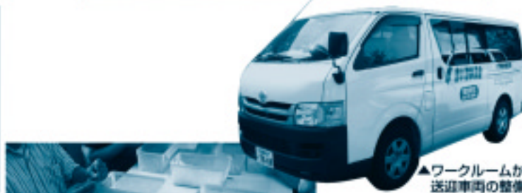
▲ワークルームかもめ送迎車両の整備