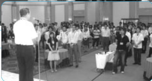
度会事務局長のあいさつを聞く参加者

連合愛知青年委員会は7月24日、ホテルグランコート名古屋において「2009ふれあいフェスティバル」を開催した。このフェスティバルは、若年層組合員に対する構成組織の枠を越えた交流機会の提供、さらには連合愛知活動への参加促進などを目的に実施している。2009年度は構成組織・加盟組合から296名、連合愛知青年委員など、およそ300名の参加があった。