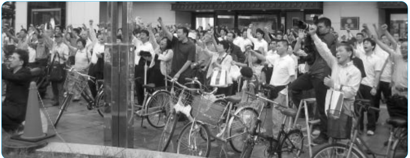
決起集会に集まった多くの組合員

それぞれが決意表明を行った。集会の最後には、栄交差点付近に集まったおよそ2000人の参加者全員で「団結ガンバロー」を行い、総選挙に向け互いの意志結集を図った。