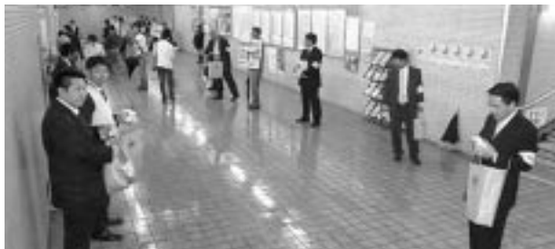
街頭カンパ活動風景

尾 張南地協では、連合愛知の要請に基づき、三役・幹事15名と政策推進議員8名の協力を得て4月14日(火)名鉄国府宮駅周辺で、「雇用と就労・自立支援」などの呼びかけとカンパ活動を実施しました。わたしたちの活動を理解してくださった多くの方々から、「ご苦労さま、がんばって!」と声をかけていただいたり、貴重なカンパ金をいただいたりすることができました。