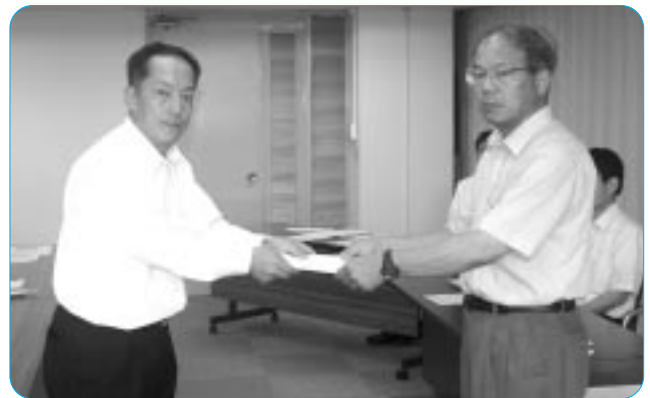
人事院中部事務局に要求書を提出する加賀官公部門長

連合愛知官公部門からの要請に対しては、人事院中 部事務局・愛知県人事委員会・名古屋市人事委員会の それぞれから、「中立・公正な第三者機関として公務勞 働者の身分・労働条件を守るという立場から最大限の 努力をする」といった主旨の回答がなされた。