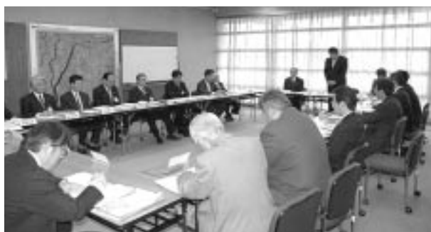
稲沢市長との懇談会の様子

尾 張南地協では、連合愛知の方針を受け、5月19日(火)稲沢地区連と政策推進議員で、組合員をはじめすべての勤労者・地域住民全体の生活向上と地域の発展に向けた重点要望書を稲沢市長に提出し、要望書に対する回答を求めるとともに、意見交換を行う市長懇談会を開催しました。地協幹事の方々からは、前向きな意見が多く出され、市長からも誠意ある回答が示されました。