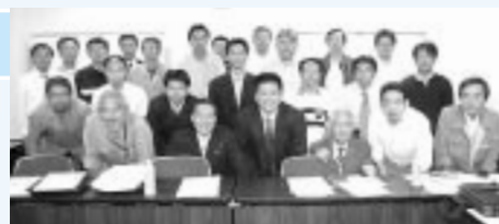
尾張南地協の役員です!

かったと言える地域をつくろう、勤労者が安心して働くことができる社会をつくろう」を合言葉に、加盟組合の横のつながりを大切にしつつ、手と手を取り合うことができる地協活動を推進していきます。