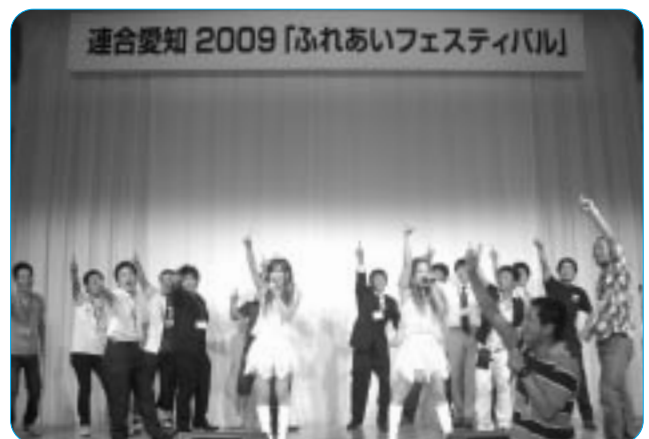
盛り上がったホワホワのステージ

刺やアドレス交換が行われるなど、参加者同士がネットワークの輪を広げることができた。フェスティバルの終盤には、ポップスデュオ「ホワホワ」によるショータイムや、ホテルグランコート名古屋の食事券・コンピュータゲーム機・南知多ビーチランド招待券などが当たる抽選会が行われ、会場は大いに盛り上がった。