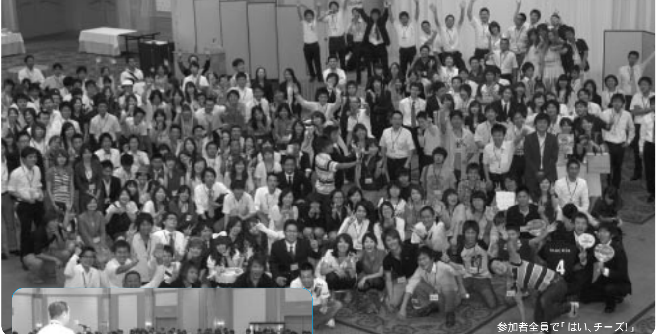
参加者全員で「はい、チーズ!」