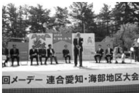
メーデー式典風景