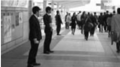
カンパを呼びかける参加者

様に呼びかけました。今回の主旨に賛同いただいた地域の方から、善意のカンパ金をいただくことができました。