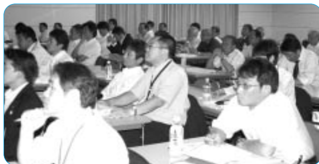
熱心に講演を聞く参加者のみなさん

5名から、政策実現に向けた議会活動について報告を受けた。参加者は2日間にわたるフォーラムを通して、地域からの政策実現に向けての方向性や課題について共通認識をもつことができた。