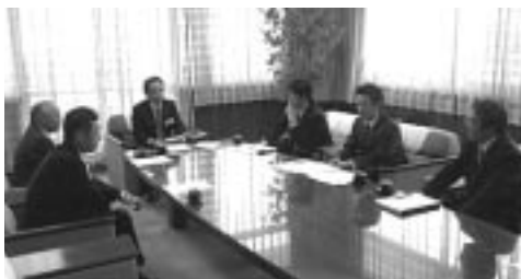
政策実現に向け、活発に意見交換