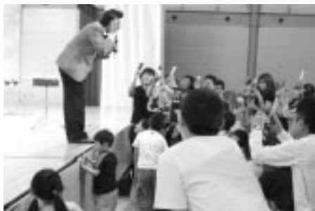
マギー審司ショーで参加者は大喜び

三河西地協は、5月9日(土)、刈谷市産業振興センターにおいて「2009メーデーフェスタ」を開催し