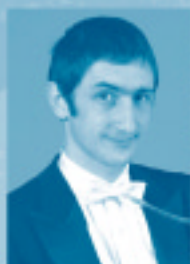
ゲオルギ・シャシコフ