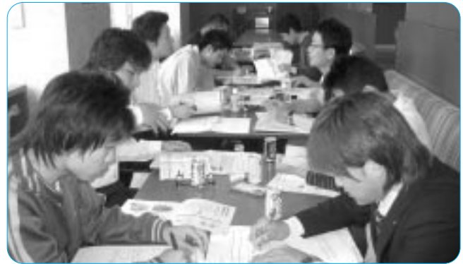
グループで話し合う青年委員

2日目は、まず、職場訪問の感想などを出し合った。青年委員からは「今回の体験を職場にもち帰って活動を広めていきたい」「今後、自分の構成組織でボランティア活動を進めていく上でいいヒントになった」などの発言があった。続いて、「ECOとやろう!キャンペーン」の成功に向け、全体及びグループで、キャンペーングッズを用いた啓発活動の内容や方法について討議を実施した。