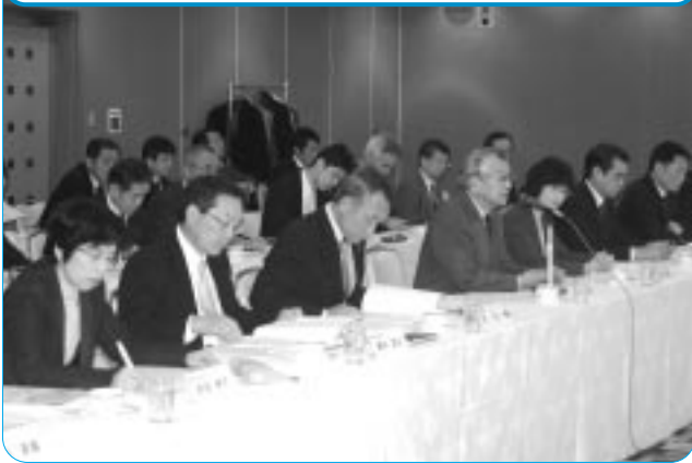
神野会長をはじめとする連合愛知側の出席者

連合愛知は2月20日、KKRホテルNAGOYAにおいて第1回愛知労使懇談会を開催した。この懇談会は、連合愛知と愛知県経営者協会とが年間2回実施しており、その時々々の労使共通の課題等について意見交換する