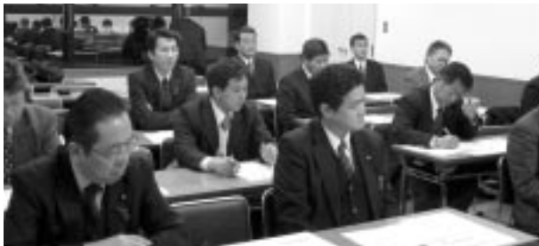
第1回政策推進会議開催

豊 田地域協議会は、第19回総会において決定した「政策推進会議を充実し、地域政策課題解決に向けた活動を展開する」の方針に基づき、12月23日に「豊田地協政策推進会議」を立ち上げました。第1回政策推進会議では、今後、行政に対して「安全で安心な暮らし」をめざし、政策要望をしていくことを確認しました。また、