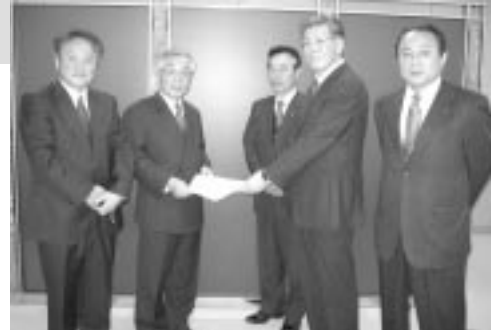
豊田市長へ政策推進議員と政策要望書を提出

と「ライフアップ21」のアンケート内容を議論しました。そこで議論を受け、1月8日には、豊田市長に対して、政策要望書を提出しました。これからも、「地域協議会が地域に果たす役割」などを模索しながら活動を推進していきます。また、行政の抱える諸課題も共有化し、共に連携をしながら活動を進めていきます。