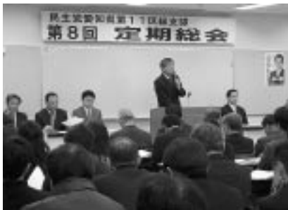
民主党総会代表あいさつ

その取り組みのひとつとして、今期は、豊田市への玄関道路の植樹帯の除草作業を予定しています。過日行われた民主党愛知県11区総支部総会では、豊田地協の渡