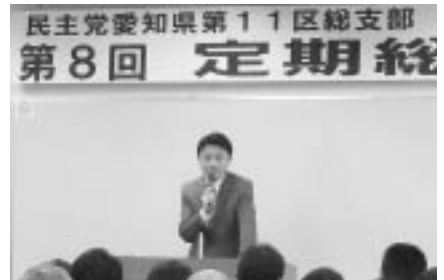
民主党総会古本議員あいさつ

邊代表が除草作業を含めた豊田地協の地域貢献活動のアピールをしました。また、支部総会では、支援政党と連携を図り政策実現に向けた活動を行うことや、来るべき総選挙において何としても「政権交代」を実現し、生活者のための政策実現をめざしがんばることを誓い合いました。