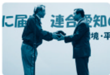
▲メーデーでのAED贈呈式