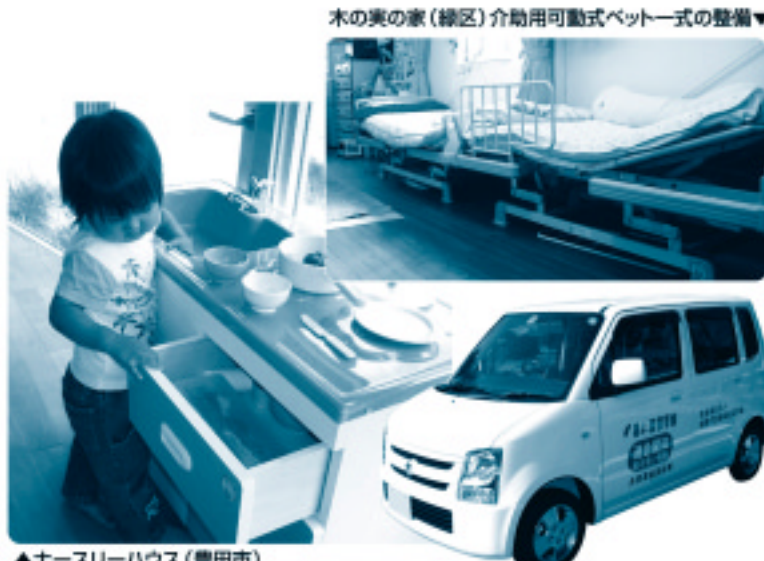
木の奥の家(緑区)介助用可動式ベット一式の整備▼