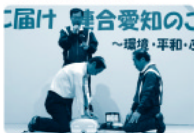
▲メーデーでのAED講習会