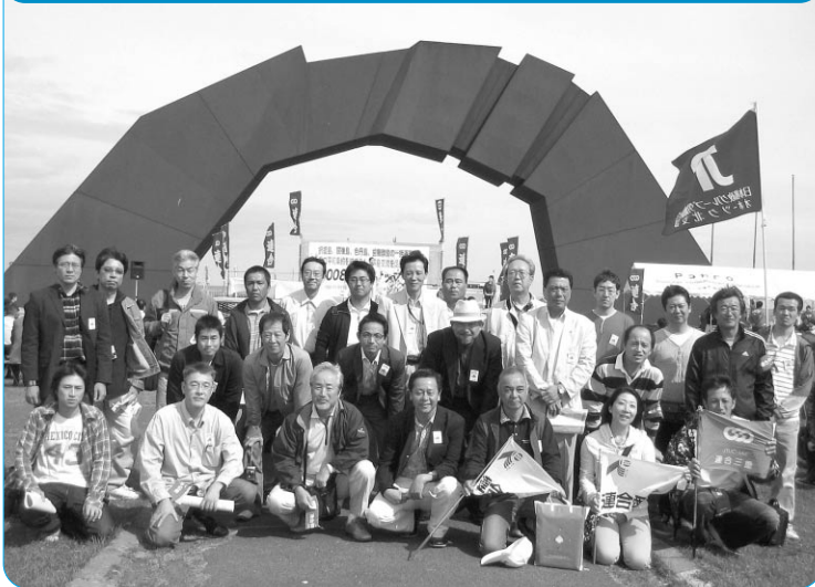
「2008平和行動 in 根室」に参加した組合員

連合は、北方領土問題の早期解決等による日ロ両国間の平和と友好を求めて、9月20日～21日にわたって「2008平和行動 in