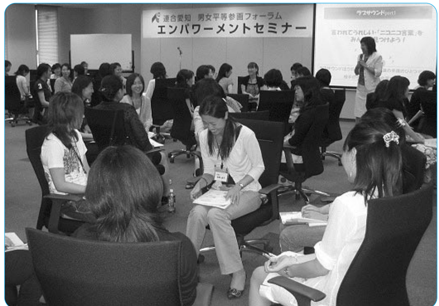
グループワークに積極的に取り組む参加者

ケーションスキルをいくつか学ぶことができた。少人数でのグループワークを体験した参加者からは、「初対面の人たちとも気軽に話げできた。職場などでもすぐに役に立つ」といった感想が寄せられるなど、有意義な研修となった。